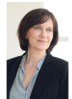
Laurence Rossignol, Ministre des Familles, de l'Enfance et des Droits des femmes

A l'occasion de ce 10ème anniversaire, je tiens à apporter un soutien plein et entier à l'association « Elles bougent ». Nous adressons ensemble un message fort aux jeunes femmes d'aujourd'hui: prenez votre place, réalisez des projets à la hauteur de vos ambitions, le collectif n'en ressortira que plus fort ! »